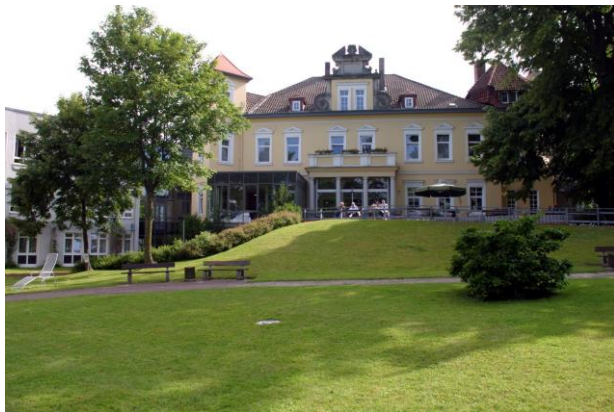
Krankenhaus Lindenbrunn, 31863 Copenbrügge

Als Kontaktstelle im bundesweiten Netzwerk des Selbsthilfeverbandes wendet sich unser Angebot an Betroffene mit neurologischen Störungsbildern, die nach einer erworbenen Hirnschädigung an Sprach- und Sprechstörungen leiden.